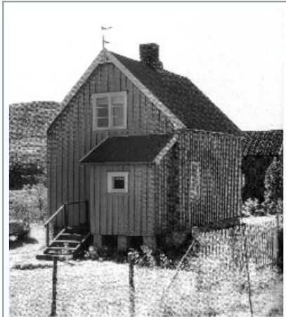
Gjenreisningshus i Billefjord, Finnmark